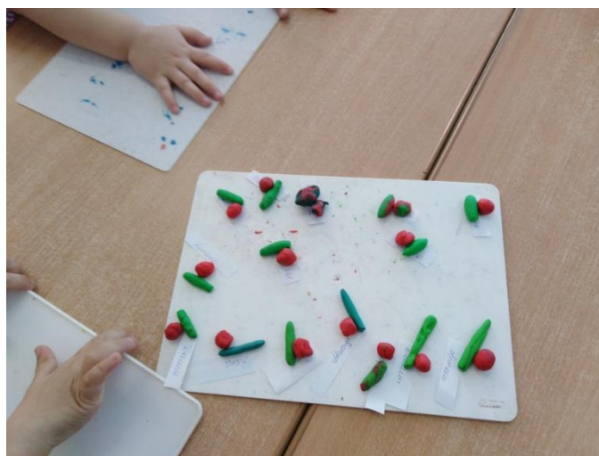
Фото «Как мы ухаживаем за луком»