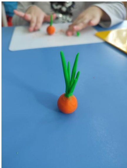
Аппликация «Наш лук пучок и чесночок»