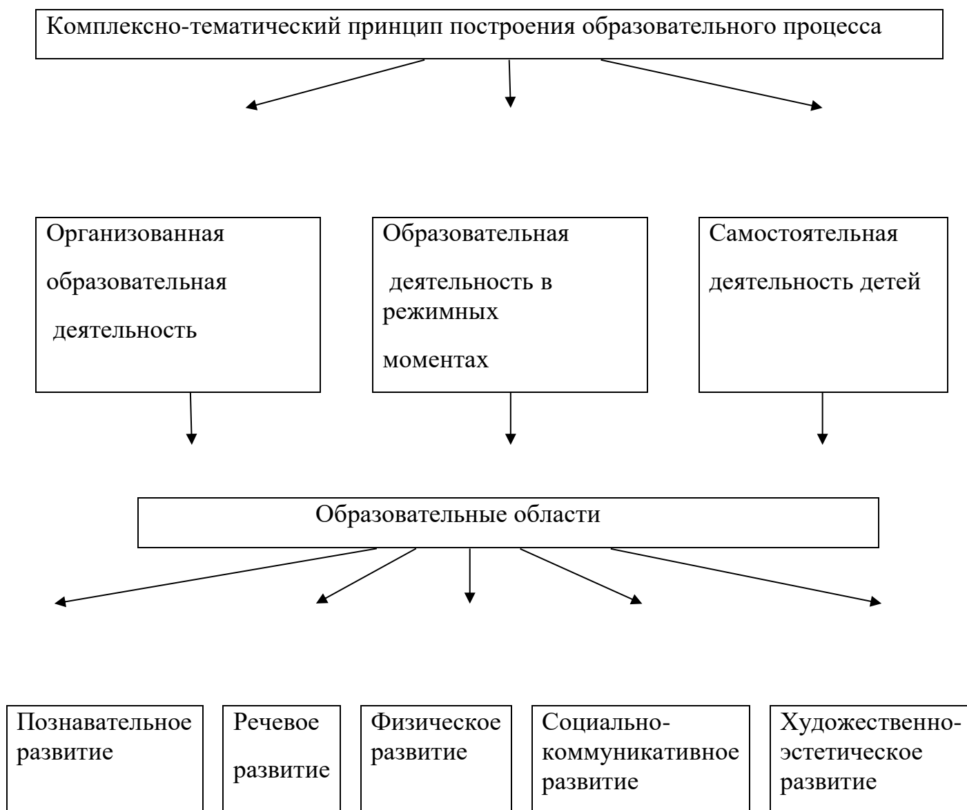
Таблица 1. Модель воспитательно – образовательного процесса